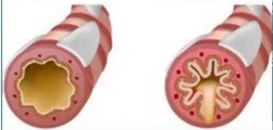
Суженные бронхи с мокротой

Не занимайтесь самолечением! При наличии симптомов обратитесь за консультацией к специалистам!